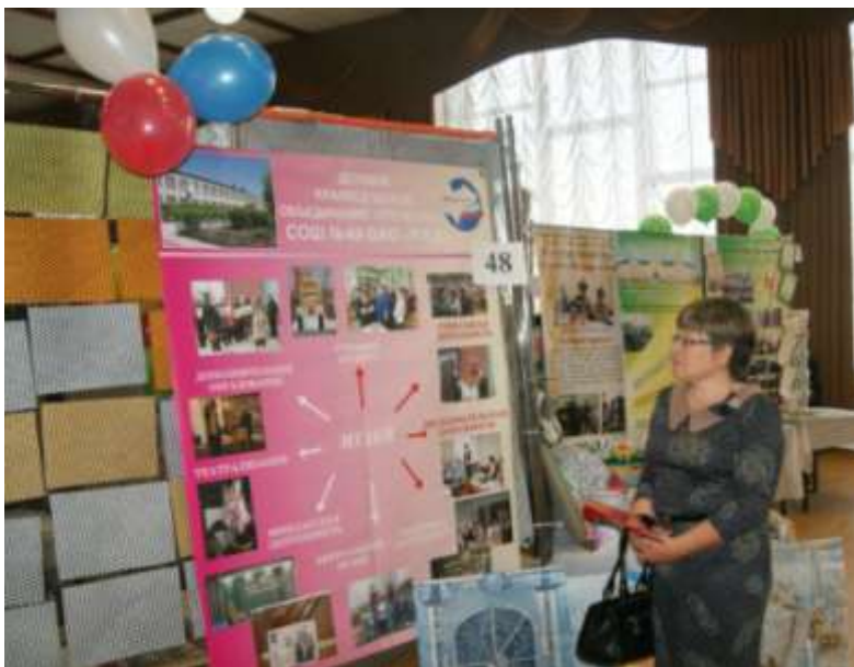
Гражданский форум Забайкальского края 2016 год