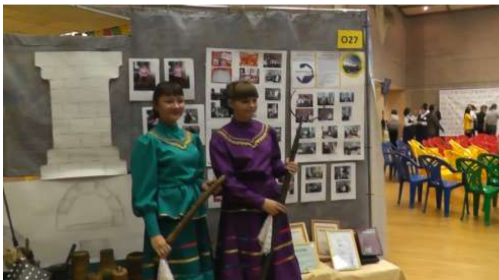
На Гражданском форуме Забайкальского края в 2014 году