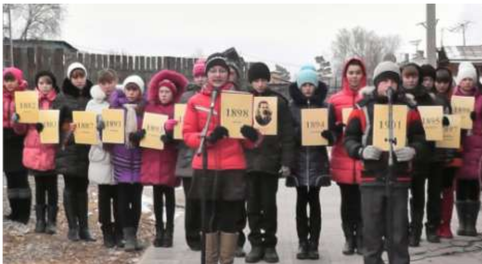
На открытии памятного знака инженеру Г.В.Адрианову (2013)