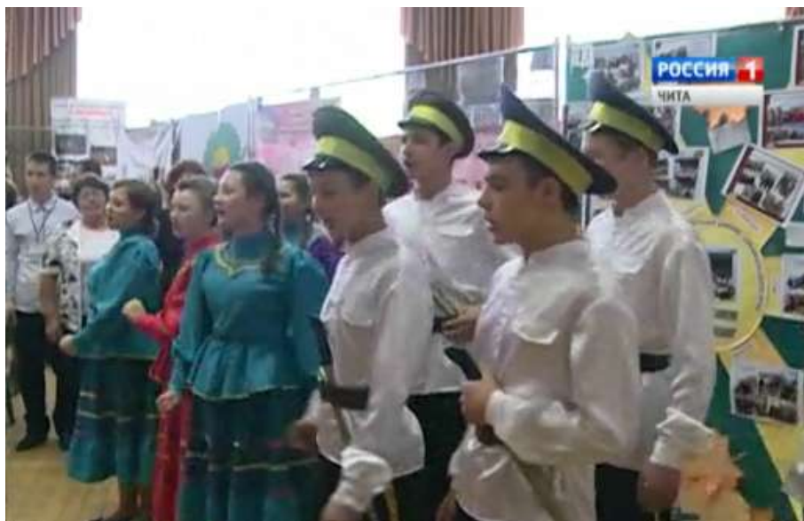
Краеведческое объединение «Отечество» и ансамбль казачьей песни «Околица» на Гражданском форуме 2015 года (Реализация проекта «Материальная и духовная культура казаков Восточного Забайкалья»)