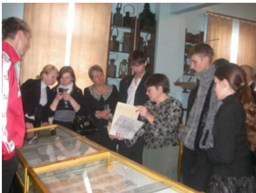
Экскурсия учащихся школы №2 п. Карымское