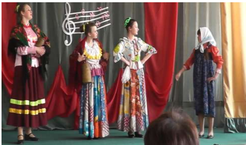
Театрализованное представление «Есть такая станция Адриановка»