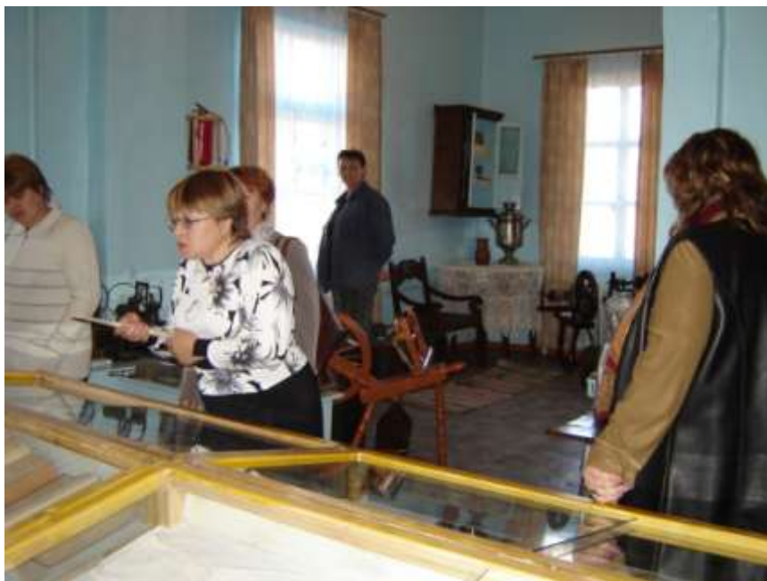
Экскурсия учителей иностранного языка из школ Карымского района