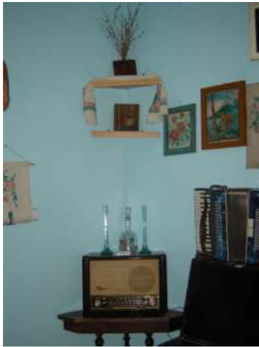
Фрагмент квартиры 50 -60-х годов 20 века.