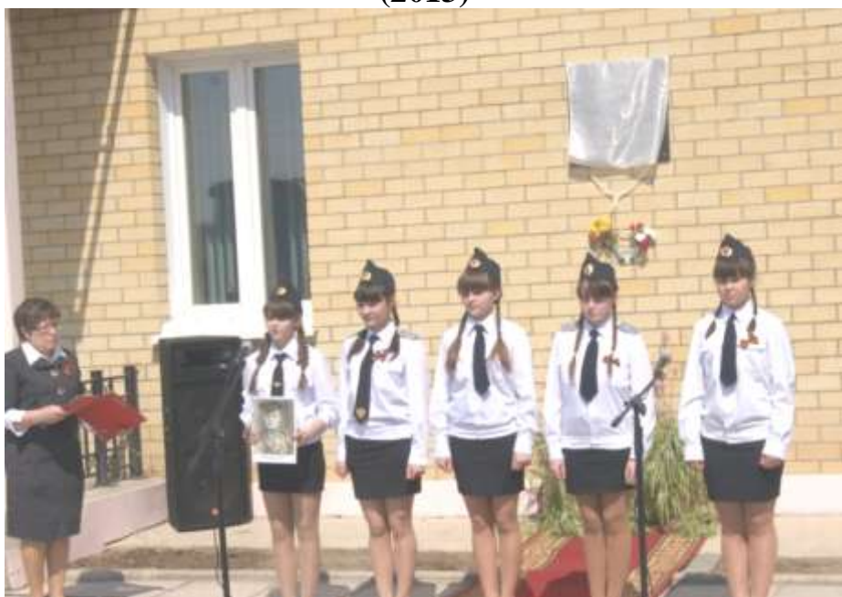
Краеведческое объединение «Отечество» на открытии мемориальной доски Герою Советского союза, ученику школы А.И.Парадовичу.